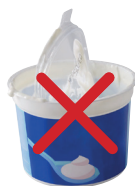
Pots de crème