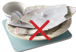
Faïence, porcelaine, grès...

Ils ne se recyclent pas et doivent être jetés aux ordures ménagères