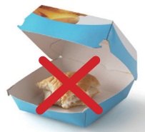
Emballages contenant des restes

Ils ne se recyclent pas et doivent être jetés aux ordures ménagères