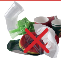
Nappe et vaisselle jetables en papier