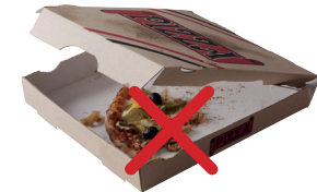
Boîtes contenant des restes