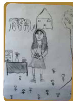
© Capucine Senné Ecole de Leschelles

Le matériel est fourni par le musée (acrylique, pastel sec, crayons de couleurs, collage de différents matériaux, supports)